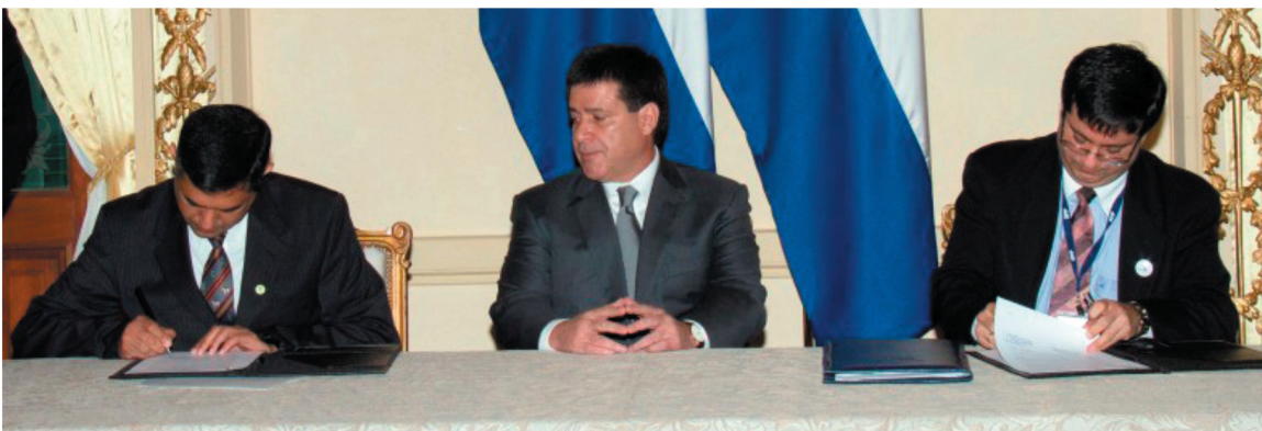
Firma de Convenio de Cooperación Interinstitucional entre la Secretaría de Acción Social y la Secretaría de la Función Pública